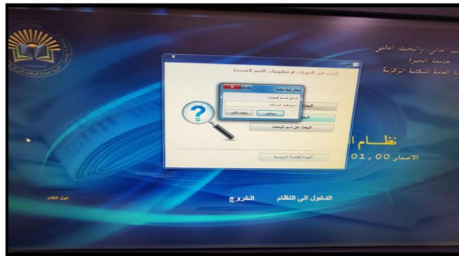
الصورة رقم (٧) البحث عن اسم الموضوع