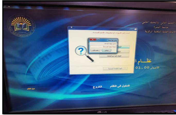
صورة رقم (٥) البحث عن عنوان الادخال (اسم الدورية) وعند النقر على عنوان الادخال اسم الدورية المطلوبة سوف تظهر النافذة التالية